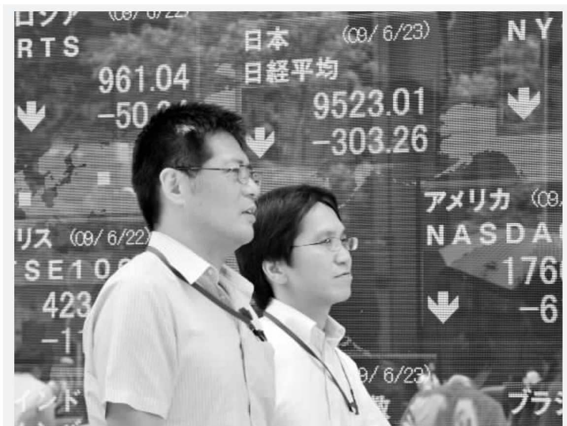
东京股市暴跌2.8%，至9550点的近一个月收盘低点

众议院金融服务委员会主席弗兰克则力挺伯南克。他表示，自己对伯南克的表现“非常满意”，他拒绝就下任联储主席人選发表更多评论。